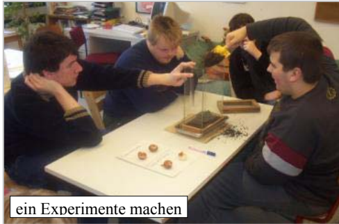
ein Experimente machen