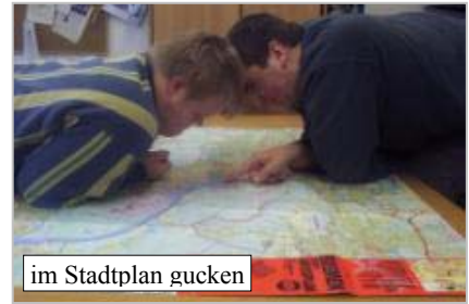
im Stadtplan gucken

Im Internet haben wir gelesen, dass die Tulpe aus der Türkei stammt. Da haben wir mal in unserem Atlas nachgesehen, wo die Türkei liegt.